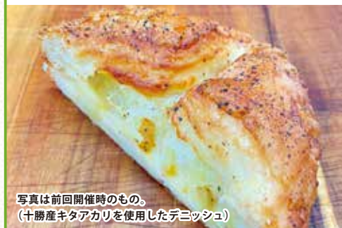
写真は前回開催時のもの。 (十勝産キタアカリを使用したデニッシュ)

台東区・墨田区内の飲食店で、十勝の食材を活かしたオリジナルメニューを開発し、そのメニューを提供（テイクアウト含む）いただき、十勝食材のPRを行います。