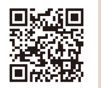
北海道型ワーケーションポータルサイト