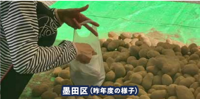
墨田区(昨年度の様子)