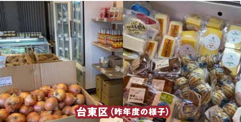
台東区(昨年度の様子)