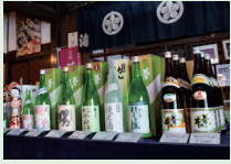
八甲田の伏流水で仕込む、絶品の「地酒」