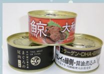
木の屋の缶詰(クジラ・マグロ・カレー)