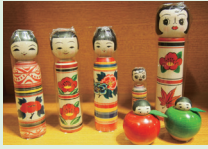
伝統的なものからかわいいものまで!「津軽系こけし」