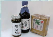
鎌田さんの蔵造り醤油・醤油税・糯ごよみ味噌