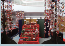
かわいい「つるしびな」