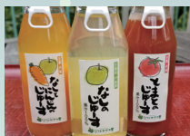
地元産の野菜と果物たっぷりのじゅーす