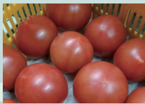
かぬまブランド認定のトマト