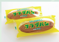
サラダパン限定販売日 12月20日、21日、22日、23日

滋賀県の東北部に位置する長浜市は、日本一大きな湖・琵琶湖や山々に囲まれた自然豊かな風景が広がります。また、街中では明治時代から黒壁銀行の愛称で親しまれた古い銀行を改装した「黒壁ガラス館」を中心に、ガラスショップや工房、ギャラリー、体験教室など魅力あふれるお店が古い街並の中に点在しています。今回は美味しいお酒やサラダパンをはじめ、長浜市を感じていただける品をたくさんご用意しています。この機会にぜひお越しくださいませ。