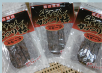
牛たんがっつり棒