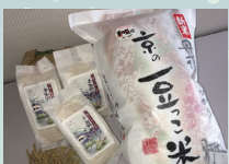
丹後こしひかり 京の豆っこ米