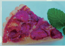
とちおとめのタルト