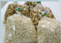
素朴な味わい マカロニボン菓子