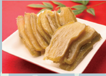
日本一の産地「ほいも」

那珂市は、東京から北東へ約100km、茨城県の中央よりやや北側に位置します。春は「日本さくら名所100選」認定の八重桜、夏はひまわりが咲き誇り、関東一の越冬地古徳沼へ白鳥が飛来する四季ならではの景色が美しい街です。清流に抱かれた肥沃な大地で育まれた新鮮野菜やほいも等、那珂市の味覚をぜひ堪能ください。