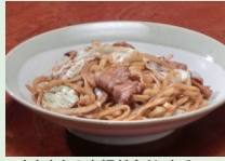
もちもちの太麺がくせになる「黒石やきそば」