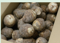
特産品「やはたいも」