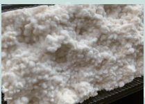
鹿沼産米で作った生麺