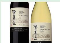
ワイン(登美の丘ワイナリー)