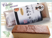
お米豆腐かすてら

与謝野町は京都府北部、日本三景・天橋立を臨む阿蘇海に面した農業と織物業の町です。町内で栽培される「丹後産コシヒカリ」は「特Aランク」を12回も獲得しているたいへん美味しいお米です。また、300年の歴史を持つ丹後ちりめんの産地でもあり、高品質の織物製品を製造、出荷しています。