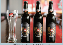
酒蔵の造った地ビール「常陸野ネストビール」