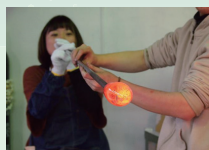
吹きガラス制作風景