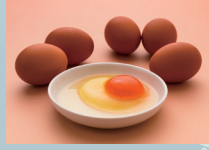
平飼いたまご「ひまわりっこ」