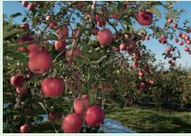
一つ一つ手間をかけられ、おいしく育った「りんご」

青森県の真ん中に位置する黒石市は、八甲田山麓の自然豊かなまちです。四季がはっきりと感じられ、種類豊富な温泉や情緒あふれる歴史的街並みを楽しむことができます。山がちな地形を活かし、日照や寒暖差でおいしく育った「りんご」を沢山お持ちします!季節の野菜や、津軽の風土が育む地酒、地域で愛される逸品をぜひお試しください。