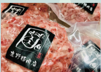
肉屋さんの手作りハンバーグ