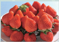
いちご市かぬま自慢の「いちご」

北関東の中心に位置する鹿沼市は、いちご王国とちぎの中でも、品質日本一!と市場評価の高いいちごの生産地です。いちご以外にも、豊かな自然の中で生産される、米、にら、トマト、こんにゃく、そば、和牛などの特産品が多数あり、また、その特産品を使用した加工食品もおすすめです。皆様のご来店をお待ちしております。