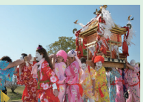
おみゆきさん(お祭り)