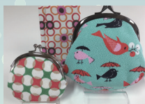
丹後ちりめんを使ったかわいいう小物達