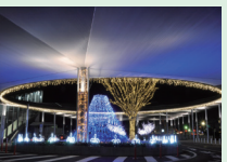
竜王駅イルミネーション

山梨県甲斐市は、甲府盆地の北西部、甲府市の隣に位置し、東京から1時間半で訪れることができる、豊かな自然と快適な都市機能が調和した美しいまちです。人口は7万5千人を超え、県内では2番目の人口となっています。都会からの移住者も「暮らしやすい」と顔をほころばせる甲斐市の魅力をお伝えします。