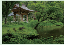
森の中で、コーヒーと手作りドーナツが楽しめる「浄仙寺」