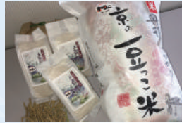
丹後こしひかり 京の豆つこ米