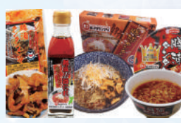
勝浦タンタンメン関連商品