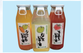
地元産の野菜と果物たっぷりのじゅーず