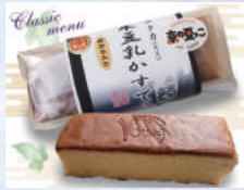
お米豆腐かすてら

与謝野町は京都府北部、日本三景・天橋立を臨む阿蘇海に面した農業と織物業の町です。町内で栽培される「丹後産コシヒカリ」は「特Aランク」を12回も獲得しているたいへん美味しいお米です。また、300年の歴史を持つ丹後ちりめんの産地でもあり、高品質の織物製品を製造、出荷しています。