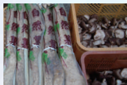
自然薯、原木栽培の椎茸