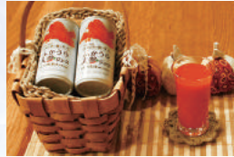
ぶかうら人参ジュース