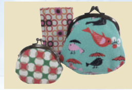
丹後ちりめんを使ったかわいい小物達