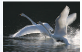
関東屈指の飛来地「白鳥」