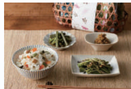
山菜混ぜご飯の素