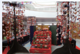
かわいい「つるしびな」