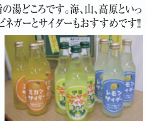
ニューサマーサイダー

伊豆半島の東海岸中央にある東伊豆町は、大川・北川・熱川・片瀬・白田・稲取の6つの温泉からなる伊豆屈指の湯どころです。海、山、高原といった自然に恵まれ、多くの美味・美景に出会えます。特産品の「稲取キンメ」の加工品やニューサマーオレンジのピネガーとサイダーもおすすめです!!