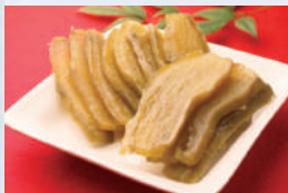
日本一の産地「ほしいも」

那珂市は、東京から北東へ約100km、茨城県の中央よりやや北側に位置します。春は「日本さくら名所100選」認定の八重桜、夏はひまわりが咲き誇り、関東一の越冬地古徳沼へ白鳥が飛来する四季ならではの景色が美しい街です。清流に抱かれた肥沃な大地で育まれた新鮮野菜やほしいも等、那珂市の味覚をぜひ堪能ください!