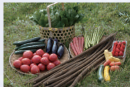
採れたて新鮮「那珂市の野菜」