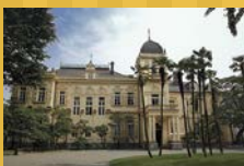
旧岩崎家住宅(国指定重要文化財)

☎03-3823-8340 http://www.tokyo-park.or.jp/park/format/index_035.html