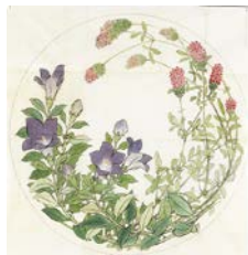
① 柴田是真 《千種之間 天井綴織下図》 明治19年 東京藝術大学蔵

🎫 ①一般430円(320円) 大学生110円(60円) ②③無料 ※( )内は、20名以上の団体料金 ※高校生以下及び18歳未満は無料 ※障害者手帳をお持ちの方とその介助者1名は無料(入館時要証明)