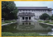
旧東京帝室博物館本館(国指定重要文化財)

☎03-5777-8600 (ハローダイヤル) https://www.tnm.jp/