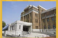
旧東京科学博物館本館(国指定重要文化財)

☎03-5777-8600 (ハローダイヤル) http://www.kahaku.go.jp/