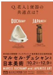
フィラデルフィア美術館交流企画特別展 「マルセル・デュシャンと日本美術」