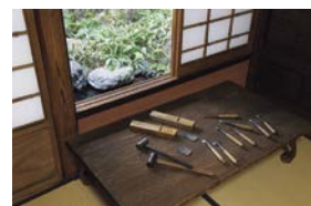
千代鶴是秀 《大工道具》

9月8日(土)~12月24日(月・休) 朝倉が蒐集した美術品や道具を紹介する特別展です。 彫刻家の視点で蒐集した多彩なコレクションをお楽しみください。