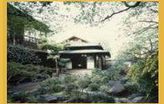
横山大観旧宅及び庭園(国指定史跡及び名勝)