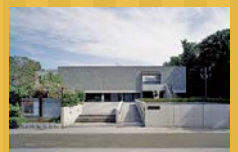
国立西洋美術館(世界文化遺産)

☎03-5777-8600 (ハローダイヤル) http://www.nmwa.go.jp/