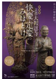
特別展「京都 大報恩寺 快慶・定慶のみほとけ」

🕒 9:30～17:00 毎週金曜、土曜日および10月31日(水)、 11月1日(木)は21:00まで開館します。 2018年9月までの日曜、祝日、休日は18:00まで開館します。 2018年9月21日(金)、22日(土)は22:00まで開館します。 ※いずれも入館は閉館の30分前まで ※時期により変動あり