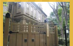
旧東京音楽学校奏楽堂 (国指定重要文化財)

☎03-3824-1988 http://www.taitocity.net/zaidan/ sougakudou/