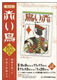
展示会 『『赤い鳥』創刊100年』