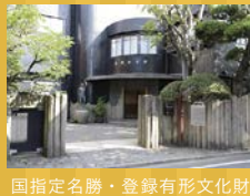
国指定名勝・登録有形文化財

☎03-3821-4549 http://www.taitocity.net/zaidan/asakura/