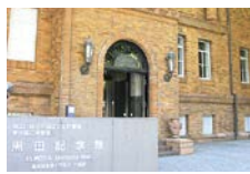
黒田記念館本館(国登録有形文化財)

所蔵する作品を定期的に展示替えしながらご紹介する[黒田記念室]と、代表作「読書」「智・感・情」などを期間限定で公開する[特別室]があります。