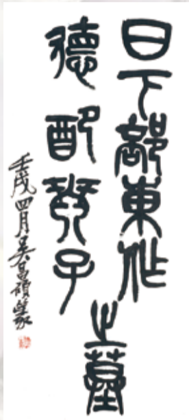
篆書日下部鳴鶴墓碑銘軸 呉昌碩筆 中華民国11年(1922) 79歳 京都国立博物館蔵