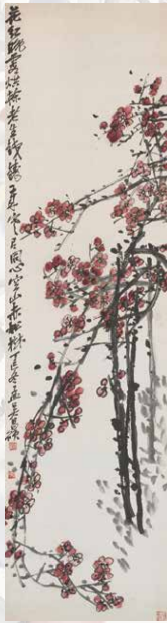
紅梅図軸 呉昌碩筆 中華民国6年(1917) 74歳 兵庫県立美術館蔵 (梅舒適コレクション)