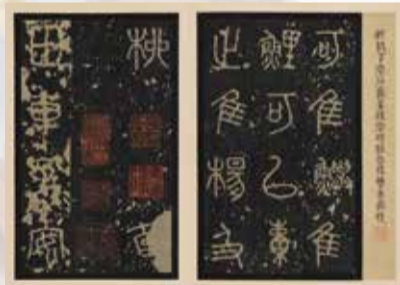
石鼓文-後勁本- 戦国時代・前5~前4世紀 三井記念美術館蔵

在世中から現代にいたるまで、内外において高い評価を博した呉昌碩作品の魅力と、かたちを超えた呉昌碩オーラを存分にご堪能ください。