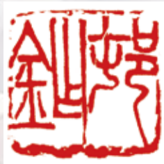
「村鉞」朱文方印 呉昌碩刻 清~中華民国時代・19~20世紀 台東区立書道博物館蔵