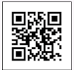
セミナー動画はこちら

ールでも24時間通報することができます。YouTube台東区公式チャンネルで「高齢者虐待防止セミナー」動画を配信中です。