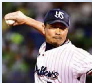
野球 館山昌平さん 元プロ野球選手