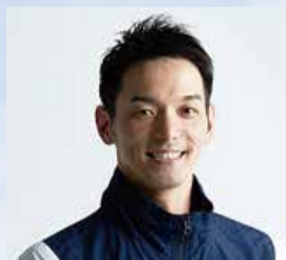
競泳 佐藤久佳さん 北京オリンピック4x100mメドレーリレー銅メダル