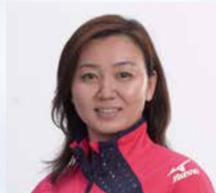
競泳 加藤ゆかさん ロンドンオリンピック4x100mメドレーリレー銅メダル