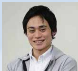
競泳 森隆弘さん アテネオリンピック200m個人メドレー6位入賞