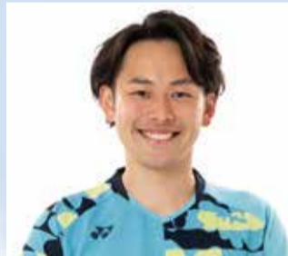
バドミントン 嘉村健士さん 東京2020オリンピックダブルスベスト8