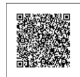
令和5年秋開始接種