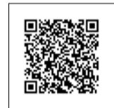
接種券の発行申請