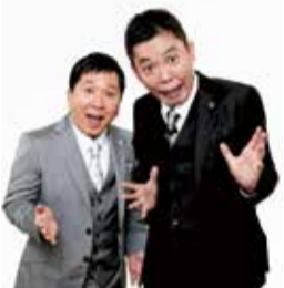
スペシャルゲスト・爆笑問題

時 10月7日(出)午後1時～3時(開場は0時30分) 場 浅草公会堂 対 区内在住か 在勤(学)の方 定 200人(抽選) ※2・3階席 スペシャルゲスト・爆笑問題 内 式典、特殊詐欺被害防止公演、爆笑問題による防犯漫才および防犯トーク 申 往復はがきに記入例1～4(在勤〈学〉の方は67も)、希望人数(2人まで)を書いて申込先へ※重複応募は無効 締 9月22日(出)(必着) 申込先 〒111-0051 台東区蔵前1-3-24 蔵前警察署内 蔵前防犯協会 関 台東区生活安全推進課 TEL (5246) 1044