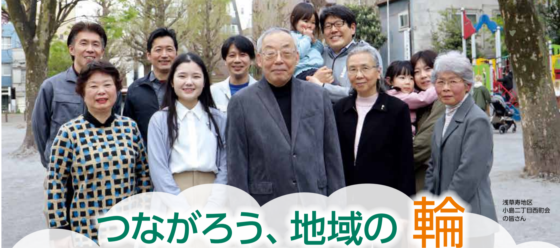
浅草寿地区 小島二丁目西町会 の皆さん