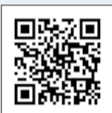
▲美術分野について詳しくはこちら