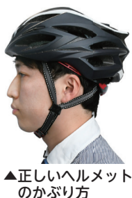
▲正しいヘルメットのかぶり方

ト着用と交通ルール遵守の徹底 ④電動キックボード等の交通ルール遵守の徹底 ⑤二輪車の交通事故防止