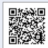
▲音楽分野について詳しくはこちら