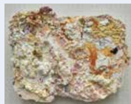
◀美術分野 土屋玲「かき」(油画)