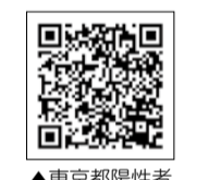
▲東京都陽性者登録センター(都HP)

体調悪化時や陽性者登録センターに関するご不明点は うちさぽ東京 (TEL 0120-670-440、24時間) へご連絡ください。