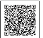
▲小児接種について

小児接種 (5～11歳) の1～3回目接種を実施しています。 詳しくは、右記二次元コードをご確認ください。 ※台東保健所での接種は11月5日(出)で終了します。 ぜひ早めの接種をご検討ください。