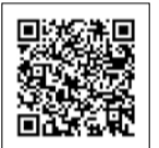
▲区HP「新型コロナウイルスワクチン接種に関する情報」