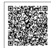
▲区HP [小児接種について]