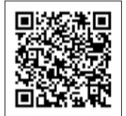
▲新型コロナウイルスワクチン接種について

接種間隔など、今後変更になる可能性があります。詳しくは、区HP等でお知らせします。