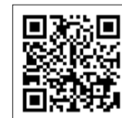
▲厚労省HP [努力義務について]