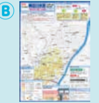
台東区神田川水害ハザードマップ