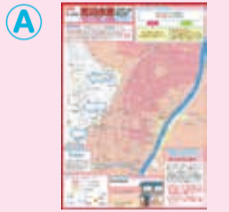
「台東区荒川水害ハザードマップ」を確認しましょう

台東区の広範囲が2週間以上浸水します。荒川氾濫のフローに従い、あらかじめ浸水想定区域外の避難先を決めておきましょう。