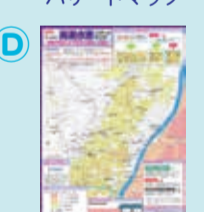
台東区高潮水害ハザードマップ