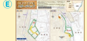
「台東区土砂災害ハザードマップ」を確認しましょう