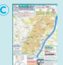
台東区内水氾濫ハザードマップ