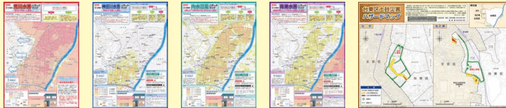
A 台東区荒川水害ハザードマップ B 台東区神田川水害ハザードマップ C 台東区内水氾濫ハザードマップ D 台東区高潮水害ハザードマップ E 台東区土砂災害ハザードマップ

ハザードマップとは、自然災害による被害を予測し、その被害の範囲を地図化したものです。あなたの自宅がある場所に色が塗られていますか?