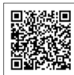
▲出店自治体スケジュール

※出店する自治体のPR情報、商品の入荷状況やイベント等について、写真を交えて発信しています。ぜひご覧ください。(IDは全てtaitoshop2017)