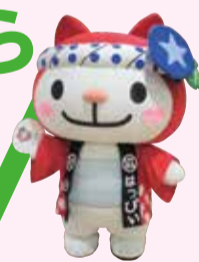
▲社会福祉協議会 キャラクター はっぴい