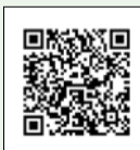
▲区公式LINE登録コード

区HPでは、2回接種をされた20・30代の方の声を集めて掲載しています。副反応に不安のある方や接種を迷っている方は下記二次元コードよりご覧いただき、ワクチン接種をご検討ください。