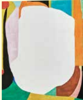
▲意味のある大きな変化 意味のない大きな変化