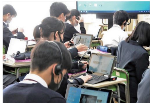
授業における活用の様子

今後も、ICT教育環境を活用したあらゆる学びの可能性を追究し、創造性豊かに、たくましく生きる力を身につけられる教育の推進に努めていきます。