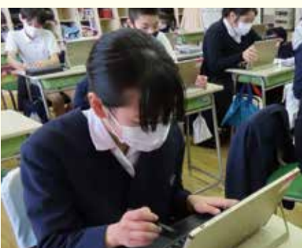
小学校での授業の様子

全児童・生徒にタブレットパソコンを配備し、授業や家庭学習においてICT機器を活用することで、児童・生徒の情報活用能力の育成を図る。