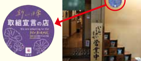
新しい日常取組宣言店ステッカー

区内飲食店舗等への感染症対策の普及・啓発を図るため、感染防止に取り組む宣言書等の配布や感染予防講習会を実施する。