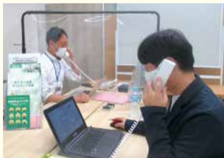
緊急経営相談ダイヤルの様子

中小企業診断士による「特別相談窓口」や「緊急経営相談ダイヤル」の設置など、充実した相談体制を継続する。