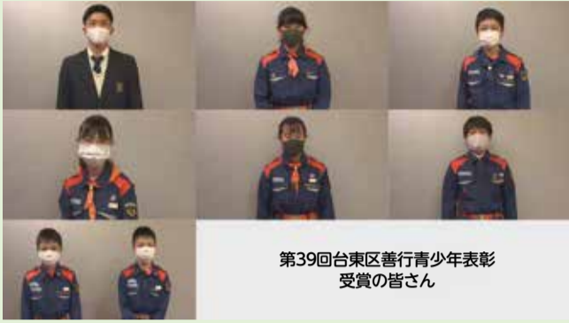
第39回台東区善行青少年表彰 受賞の皆さん

区では、日頃からその行動が他の模範となると認められる青少年および団体を表彰しています。2年12月14日に表彰式を行い、次の方々に褒状と記念品を贈りました。※本事業は、平成30年度まで「台東区青少年をほめる運動」として行っていた事業です。