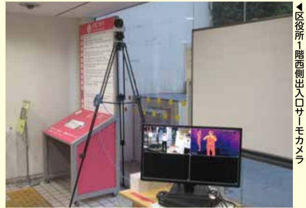
区役所1階西側出入口サーモカメラ

また、期間中、中央出入口を閉鎖しております。ご不便をおかけしますが、ご理解・ご協力をお願いします。