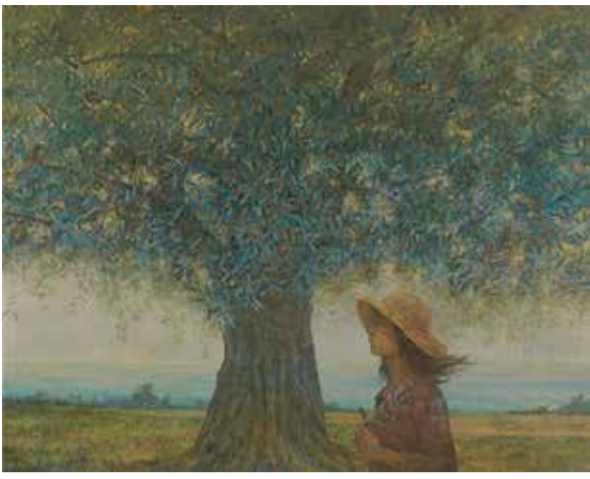
平成22年度台東区長賞受賞作品(日本画)「碧波の風~島に会う」宮川翠