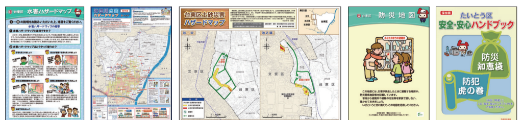
ハザードマップ(水害、土砂災害)