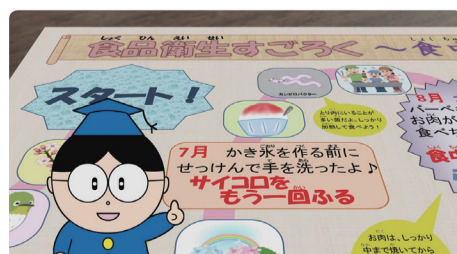
●食品衛生すごく~食中毒にならないで!