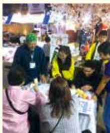
昨年の展示会の様子

海外展開を目指す企業を支援するため、タイ(バンコク)で行われる国際展示会に台東区ブースを出展するとともに、タイの現地バイヤー等を台東区に招致し、区内事業者との商談や意見交換の場を設ける。