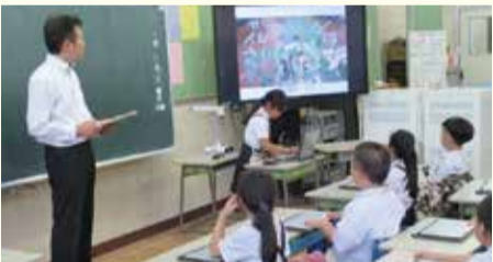
モデル校(小学校)での様子

情報活用能力の育成を図るため、全小中学校のICT環境を整備し、タブレットパソコン等を活用した授業を実施する。