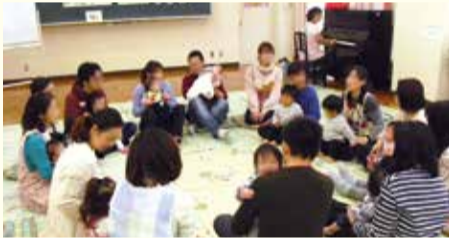
「ふたごちゃん、みつごちゃん集まれ!交流会」の様子

多胎児の出産・育児をサポートするパンフレットを作成し、情報提供する。また、公的機関での手続き等の際にもヘルパーが付き添いできるように、多胎児家庭への外出サポートを充実する。