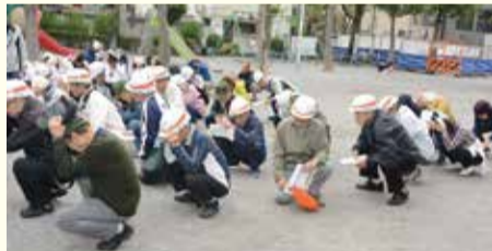
地震が起きた時に頭を守るシェイクアウト訓練(総合防災訓練)の様子

被災者支援等の充実を図るため、避難所等の蓄電池を増設するとともに、防災情報収集カメラの増設等による災害対策本部体制の強化を図る。また、自助・共助の取り組みをより一層進めるため、水害ハザードマップ等を改定し、全戸配布を行う。