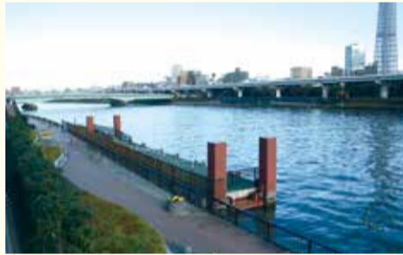
浅草二天門防災船着場

台東区の浅草二天門防災船着場と墨田区の北十間川の(仮称)小梅橋船着場間に船を運航する「(仮称)渡し舟クルージングイベント」を両区が連携して実施する。