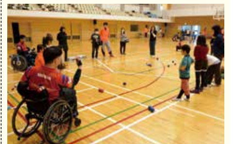
ボッチャ体験会の様子

区民の障害者スポーツへの関心を高め、共生社会の実現を目指すとともに、パラリンピック競技大会の機運醸成を図るため、正式種目であるボッチャの交流大会を開催する。