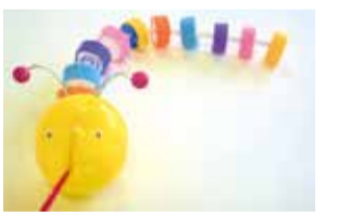
▲キャップをつなげて★イモムシづくり

場所 ①②7階集会室 ③④4階ワークショップルーム、精華公園ピオトープ 持ち物 筆記用具、飲み物、タオル、持ち帰り用の袋等※汚れても良い服装で参加、④は長袖長ズボン 費用 ②150円 ③④100円 申込方法 催し名・住所・氏名・学年(年齢)・同伴者の有無・電話番号を電話かファックスまたは直接下記問合せ先へ※①は大人1人につき子供1人まで、②③は大人1人につき子供2人まで(対象未満の入室はできません) 問合せ 環境ふれあい館ひまわり環境学習室 TEL(3866)2011 FAX(3866)8099