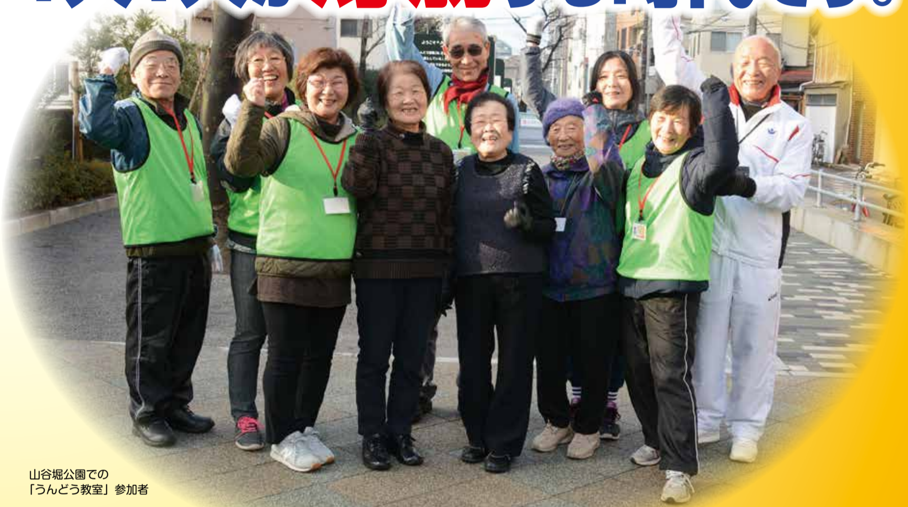
山谷堀公園での「うんどう教室」参加者