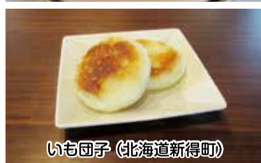
いも団子 (北海道新得町)

無料 模擬体験機で牛の乳搾り 午前11時30分・午後2時 ※各回定員50人 ※開始1時間前から十勝ブース前で整理券を配布します。