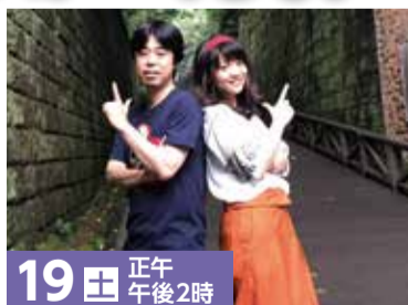
19日 正午 午後2時 日本酒のうた (Sunray in Rain)