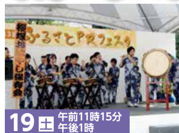
19日 午前11時15分 午後1時 お囃子 (茨城県筑西市)