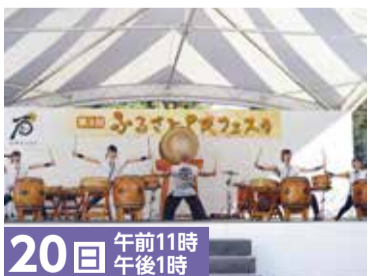
20日 午前11時 午後1時 太鼓パフォーマンス (浅草たいこばん)