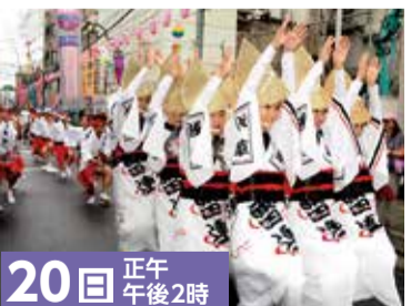
20日 正午 午後2時 阿波踊り (浅草雷連)