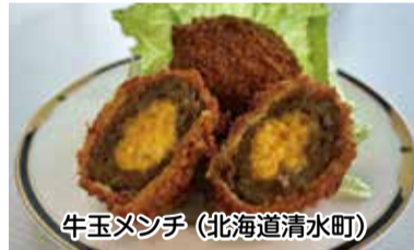
牛玉メンチ (北海道清水町)

(新得町・鹿追町・清水町・芽室町・池田町) 北海道十勝地域のご当地グルメや特産品を販売