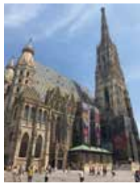
▲シュテファン大聖堂