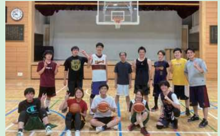
▲バスケットボール部

また、台東区には多くの文化・体育サークルや部活動があり、活動を通して職員同士のつながりをより強いものにしていきます。 (参加は自由)