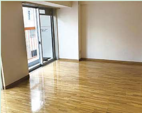
▲単身用職員住宅の一例

区内5か所に職員住宅があります。新規採用職員に対しては、入区前に募集を行います。また、入居希望者を対象に内覧会も実施しています。希望に添えなかった場合でも、空き室状況に応じて定期的に申し込みを行うことができます。なお、職員住宅は単身用49戸・世帯用34戸あり、若手から子育て世代まで、幅広い世代に対応しています。