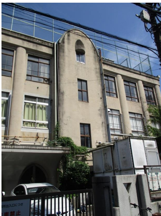
旧坂本小学校 現況写真