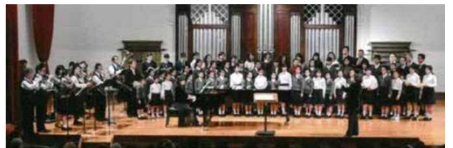
第28回演奏会の様子(平成30年12月22日)

●お問合せ先：生涯学習課社会教育担当 ☎5246-5851 FAX 5246-5814 〒111-8621 台東区西浅草3-25-16