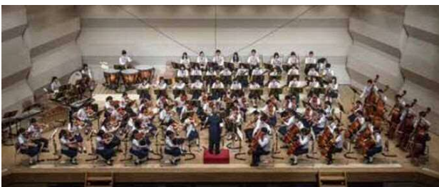
第38回定期演奏会の様子(平成30年9月2日)