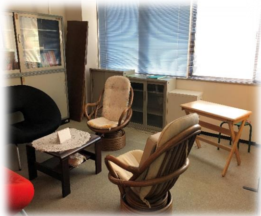
＜ 相談室 ＞