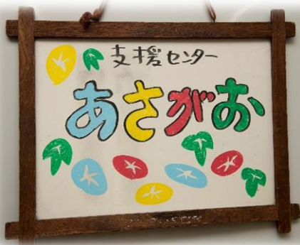
いりぐちかんばん < 入口看板 >

しゅ たいしょう せいしんしょうがい も かた <主たる対象 : 精神障害をお持ちの方>