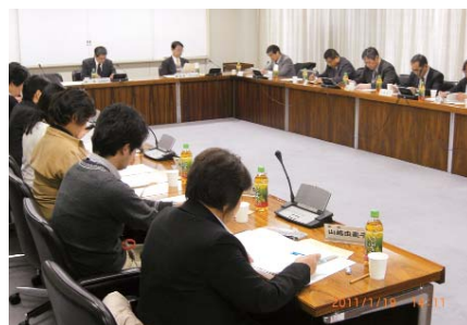
高齢者虐待防止連絡会の様子（1月19日）

高齢者虐待の防止、早期発見・対応には、法律、医療、保健、介護、警察、人権などの専門機関の連携が必要です。そこで、台東区では連絡会を開催し、情報交換を行いながら、検討会を適宜開催し、虐待防止に努めています。