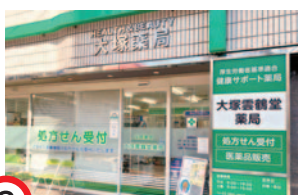
8 大塚雲鶴堂薬局 元浅草4-6-4 ☎ 3841-6880