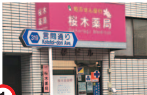
1 桜木薬局 上野桜木1-11-13 ☎ 3822-1027