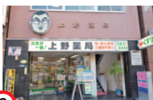
2 有限会社 上野薬局 上野3-17-5 ☎ 3831-5441