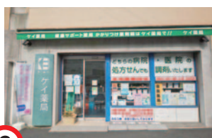
6 ケイ薬局 浅草3-4-1 ☎ 3876-1506