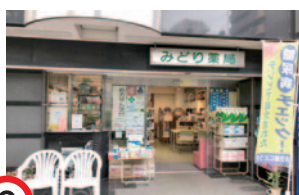
9 みどり薬局 蔵前4-21-9 ☎ 3851-0054