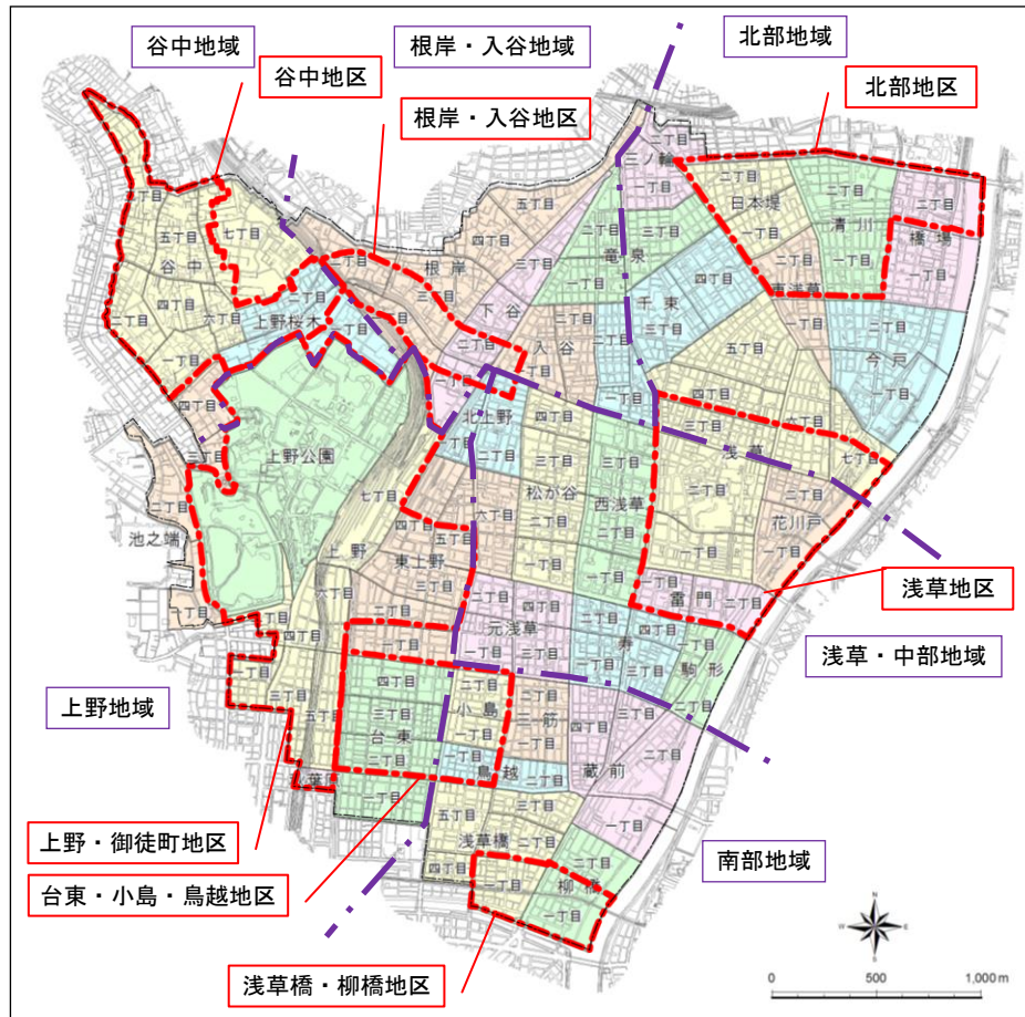
まちづくり重点地区候補の選定理由