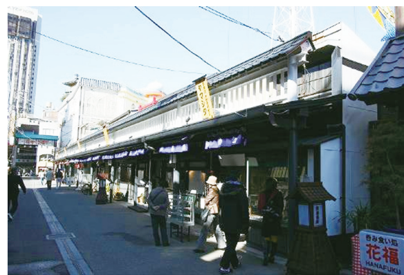
▲ 花やしき通り商店街