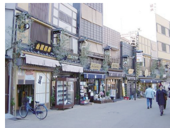
▲ 景観まちづくり協定を結んだ伝法院通り