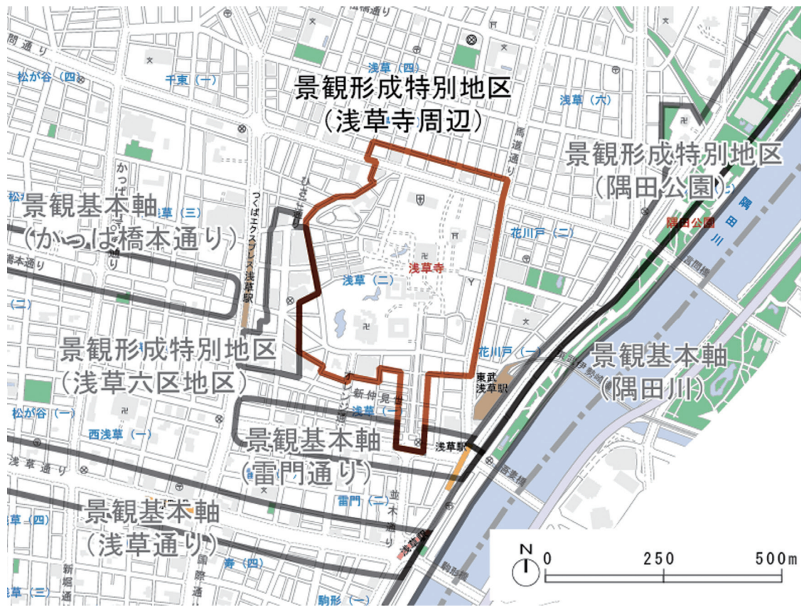
図 2-11 対象区域