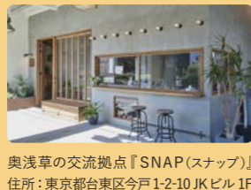
奥浅草の交流拠点『SNAP (スナップ)』 住所：東京都台東区今戸1-2-10 JKビル1F

このまちには、閉ざされている扉の向こうに、価値あるものがまだまだたくさん眠っていると思います。SNAPのように 一部分だけでもまちに開いて、人と人がつながる きっかけが増えることで、新しい賑わいが生まれていくといいですね。