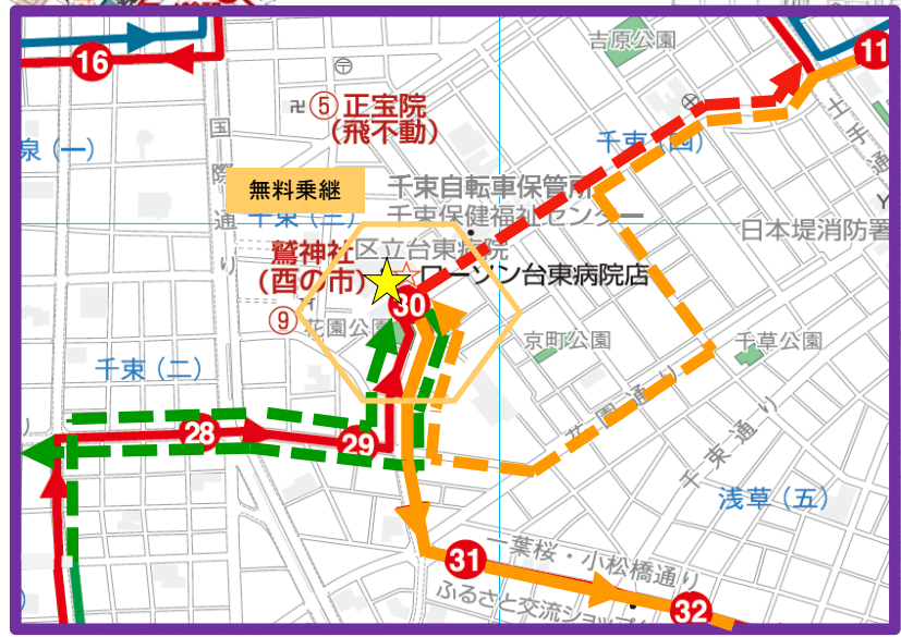
【台東病院周辺拡大図】

東西めぐりん □目的 ○お彼岸時土休日のダイヤ乱れの緩和 □運行概要 ○お彼岸時土休日に、⑬千駄木駅から不忍通りに迂回