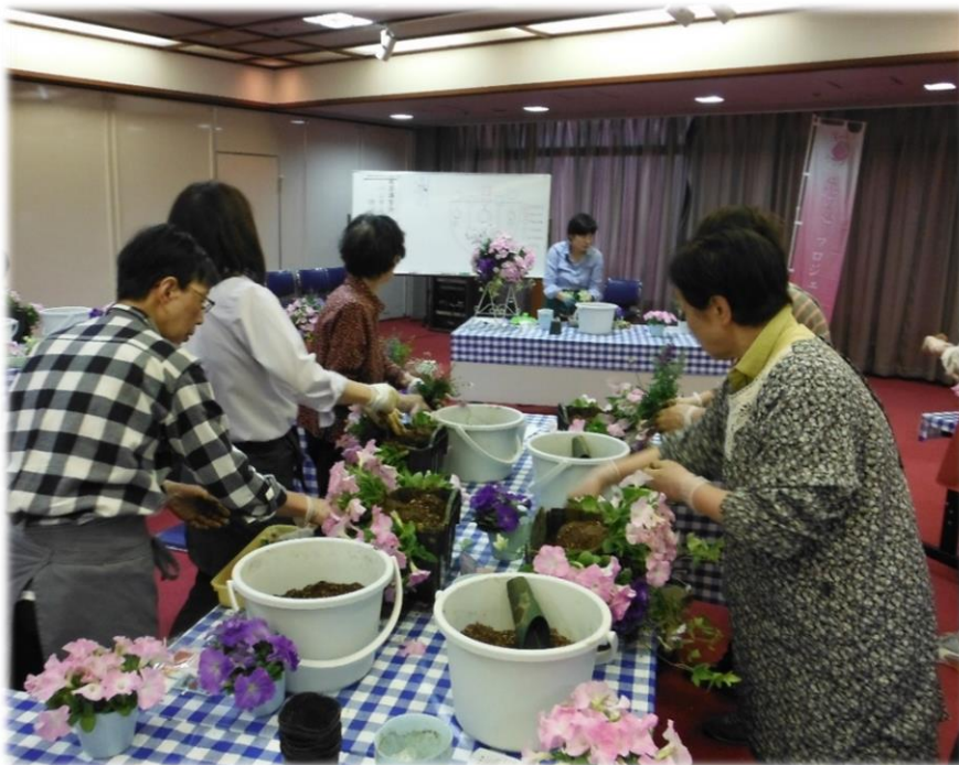
平成 30 年度春の園芸講習会（ハンギングバスケット）の様子