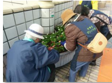
グリーン・リーダーの活動の様子

これらの取り組みは、区民・事業者・区が連携・協働することが必要です。今後とも、グリーン・リーダー等の人材を育成して、花とみどりの活動の輪を広げていきます。