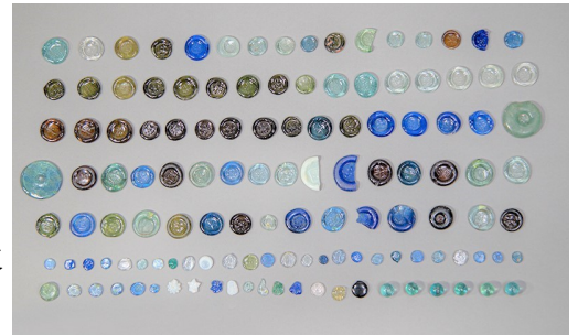
▲竜泉寺町遺跡出土ガラス製品(おはじき等)

鉛筆、絵の具を溶かすパレット、おはじき、石けり遊びで使うガラス製品など、子どもたちが使っていたと思われるもの、お皿や熱で溶けてしまったガラス瓶など、当時の生活に関わるものをご覧いただけます。また、区内のほ