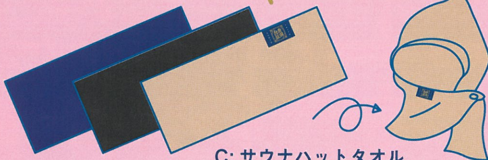
C: サウナハットタオル (3色展開)