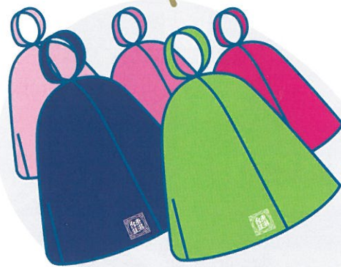
B: サウナハット (5色展開)